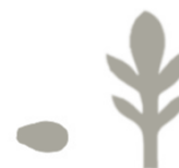
Oblika kličnega in pravega lista

Zatiranje Mehansko zatiranje je dovolj dober ukrep za zmanjšanje prisotnosti te vrste.