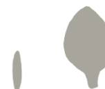
Oblika kličnega in pravega lista

Zatiranje Ker rastlina obilno semeni, je potrebno na njivski površini to preprečiti. Mehanska obdelava, konkurenčne vrste kulturnih rastlin, ter kemično zatiranje so učinkoviti ukrepi pri zatiranju poljskega maka.