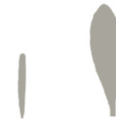
Oblika kličnega in pravega lista

Oranje, prekopavanje, česanje njivskih površin, solarizacija, podsetev rastlin, ki preprečijo vznik dresni, gosta setev višjih rastlin.