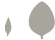
Oblika kličnega in pravega lista

Zatiranje Ročno puljenje ali mehanska obdelava polja pred cvetenjem rastlin sta lahko zadovoljiva ukrepa za zatiranje pasjega zelišča. Kemično tretiranje po setvi ali vzniku je uspešen ukrep pri ustavitvi širjenja rastline.