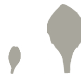
Oblika kličnega in pravega lista

Zatiranje Zatiranje regrata je težavno prav zaradi načinov razmnoževanja. Mehanska obdelava lahko rastline regrata še namnoži in tako poveča problem. Oranje mora biti dovolj globoko, da zajame celotno korenino plevela, košnja pa dovolj pogosta, da prepreči semenenje. Možno je tudi tretiranje s herbicidi.