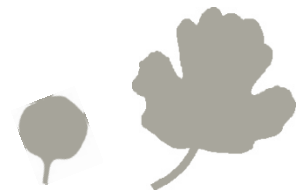
Oblika kličnega in pravega lista

Zatiranje Rastlina z rast običajno potrebuje veliko svetlobe, zato njeno pojavnost uspešno zmanjšamo s posevki z veliko konkurenčno sposobnostjo.