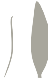
Oblika kličnega in pravega lista

Zatiranje Odstranjevanje posamičnih rastlin v zgodnjih fazah, posebej pred semenenjem je najučinkovitejše pri zatiranju ozkolistnega trpotca. Kasneje je zatiranje težje. Na voljo so kemični pripravki, ki lahko učinkovito zatirajo trpotec (npr. na osnovi MCPA, 2,4 D, mekoprop).