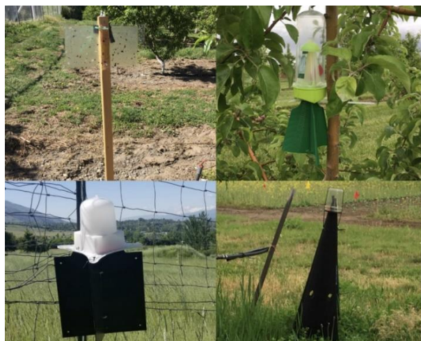
Slika 1: Vabe, namenjene lovu in spremljanju marmorirane smrdljivke

Poleg omenjene metode obstajajo tudi tiste, ki so bolj podobne metodam detekcije v agroekosistemi. Sem spadajo uporaba različnih vrst pasti, ki so lahko svetlobnega tipa, lepljive plošče ali pasti s feromoni, ki privabljajo stenice v rastni dobi in služijo odlovi letnih populacij. Prav tako se uporabljajo različne mehanske pasti, kot so lovske škatle, režaste pasti, s katerimi v jesenskem delu leta lahko prestrežemo prezimne populacije (Lee in sod., 2013; Maistrello in sod., 2014). Obstajajo tudi druge mehanske metode, kot je lov z metuljnico, ali pa na splošno vizualni pregled rastlinskih vrst in poskus določitve pojavnosti odraslih osebkov, ličink ter jajčnih legel (Bae in sod., 2019).