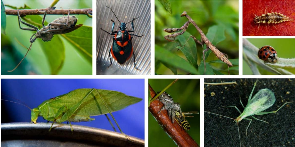
Slika 4: Naravni sovražniki stenice

Uporaba pripravkov, ki temeljijo na specifičnih koristnih vrstah, ki plenijo ali parazitirajo marmorirano smrdljivko v urbanem okolju, ni stalna praksa in tudi ni najbolj smiselna. V tem kontekstu je namen teh priporočil predvsem usmerjanje ljudi z smernicami, ki bi povečale biotsko pestrost koristnih organizmov v urbanem okolju. Površine, ki so urejene in bogate z raznolikimi vrstami rastlin, privabijo tudi različne plenilske vrste, kot so pajki, polonice, tenčičarice, in druge parazitoidne vrste, ki lahko pomagajo omejevati število invazivne stenice (Abram in sod., 2017; Leskey in Nielsen, 2018).