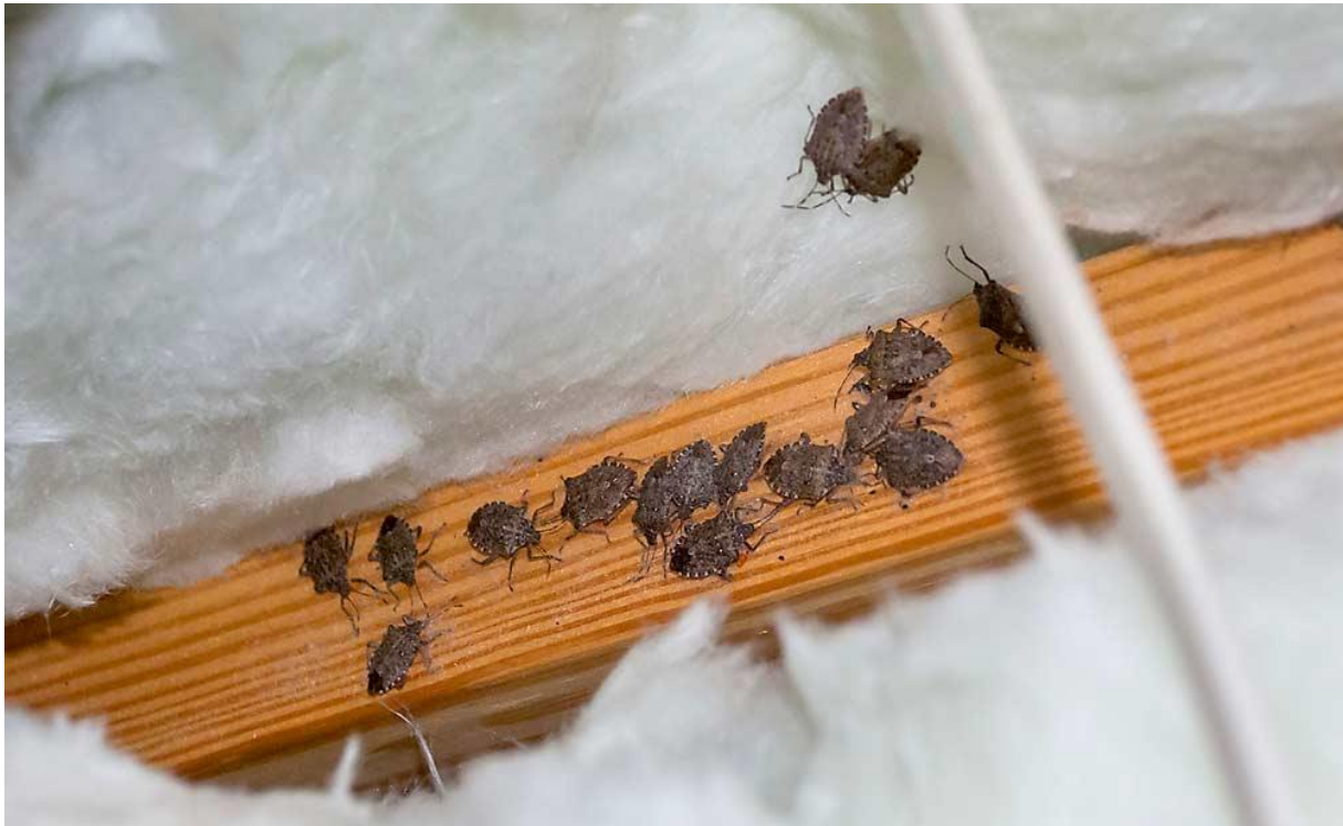
Slika 5: Prikaz prezimovanja marmorirane smrdljivke v bivalnem objektu ljudi

Ob množičnem pojavu škodljivca, predvsem v jesenskem obdobju, ko išče prezimovališča in se ob izločanju agregacijskih feromonov zbira na objektih ljudi, se lahko ljudje poslužijo metod, kot so mehansko odstranjevanje stenec s fasad s pomočjo sesalnih naprav, zapiranje vrzeli, razpok in drugih odprtih v domovih ter uporabo protiinsektnih mrež na oknih in vratih stanovalnega objekta (vir: https://www.canr.msu.edu/resources/managing-brown-marmorated-stink-bugs-in-homes-gardens ).