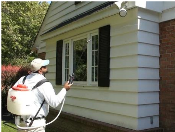
Slika 4: Prikaz kemičnega zatiranja stenice v urbanem okolju

Kemično zatiranje bi se po našem mnenju v urbanem okolju lahko uporabljalo le v primerih množičnega pojava ali zbiranja škodljive vrste. Le v takšnem specifičnem primeru bi posameznik ali odgovorna služba lahko ukrepala in škodljivca zatrla. Učinkovita sredstva namreč spadajo pod širokospektralne pripravke, ki bi lahko negativno vplivala na vse ostale koristne žuželčje vrste ter tudi na ljudi in ostale živali urbanega okolja (Morrison in sod. 2016, cit. po Kuhar in Kamminga, 2017).