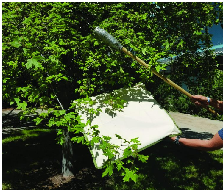
Slika 2: Vizualno pregledovanje rastlin v urbanem okolju