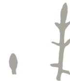
Oblika kličnega in pravega lista