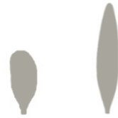
Oblika kličnega in pravega lista

Oranje in prekopavanje in s tem preprečevanje razmnoževanja sta učinkovita za zmanjšanje pojavnosti plevela. Vrsta je občutljiva na večino dostopnih herbicidov, ki jih uporabimo pred in po vzniku.