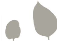
Oblika kličnega in pravega lista

Zatiranje Izkopavanje celih rastlin, uporaba zastirk, ob večjem pojavu kemično tretiranje z neselektivnim sistemskim herbicidom (glifosat).