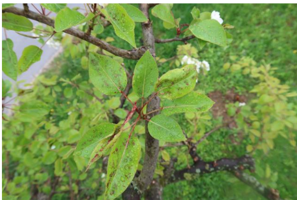
Slika 1: znamenje napada hruševe rjaste pršice