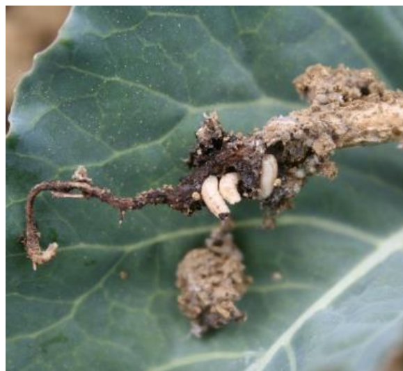
Slika 2: Ličinke kapusove muhe objedajo glavno korenino cvetače.