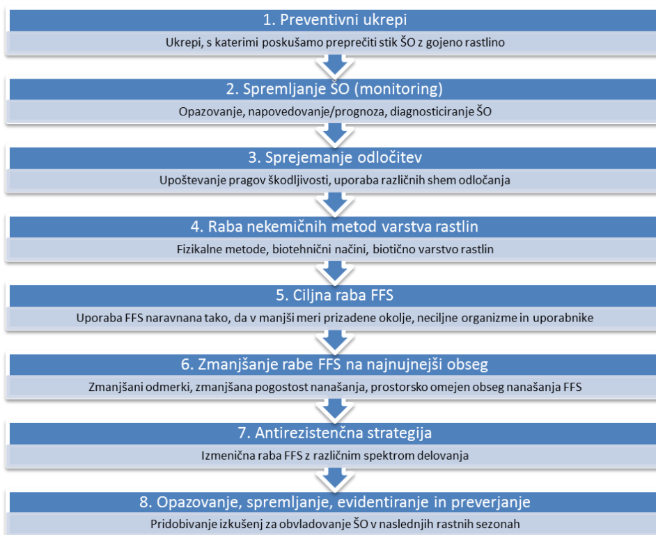
Slika 2: Temeljna načela integriranega varstva rastlin