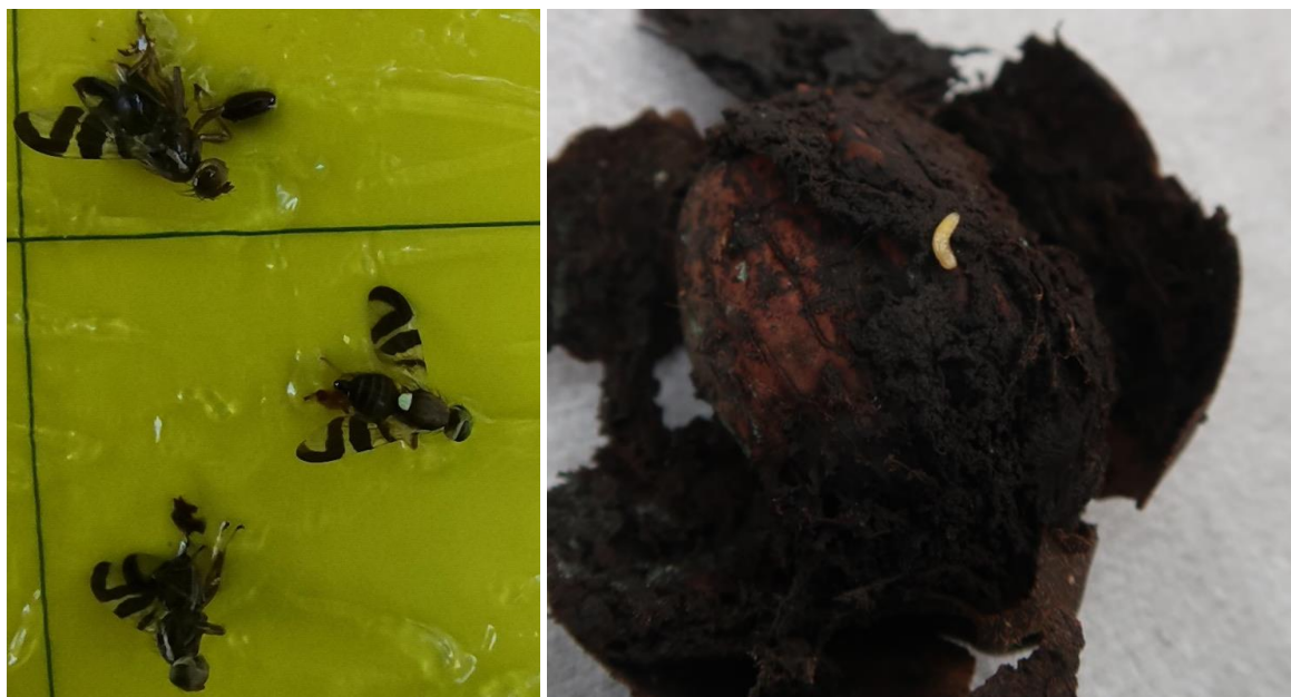
Slika 2: Ujeti osebki orehove muhe na rumeni lepljivi plošči (levo) in žerke, ki se prehranjujejo z zeleno lupino orehov (desno)

Optimalen čas za prvo škropljenje je približno 5 dni po prvih ulovljenih muhah . Po opravljenem škropljenju nadaljujte s spremljanje ulovov na rumenih lepljivih ploščah. V kolikor se škodljivec še vedno lovi, je potrebno tretiranje ponoviti v presledku enega do dveh tednov . Prav tako je potrebno škropljenje ponoviti po močnih padavinah , ki sperejo zastrupljeno vabo. V primeru nestanovitnega vremena je priporočljivo počakati, da se vremenske razmere stabilizirajo.